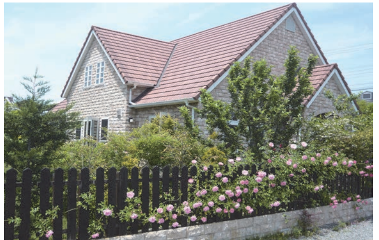
5月のクイーンズ・マナー（駐車場から撮影）

レッスンだけでは実現できないほんものの英語環境——日本にいながら別世界をたのしんでいただけることを期待しつつ、みなさまのおいでをお待ちしております。